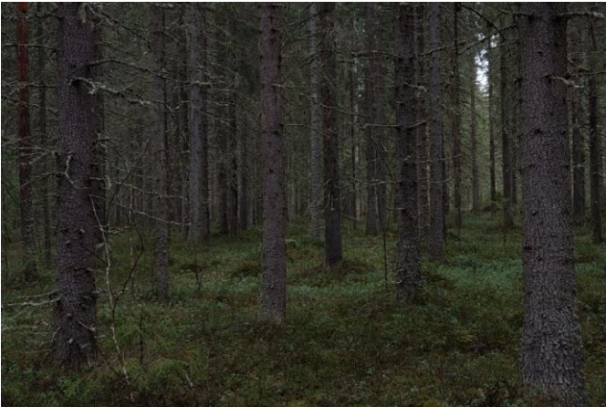
Vanhaa kuusimetsää Hemmunkallion alapuolella

Seuraavassa omat perusteeni, miksi vastustan Pysäysperän hankkeen sijoittumista Hemmunkallion-Sauviin-kallion väliselle metsäalueelle: