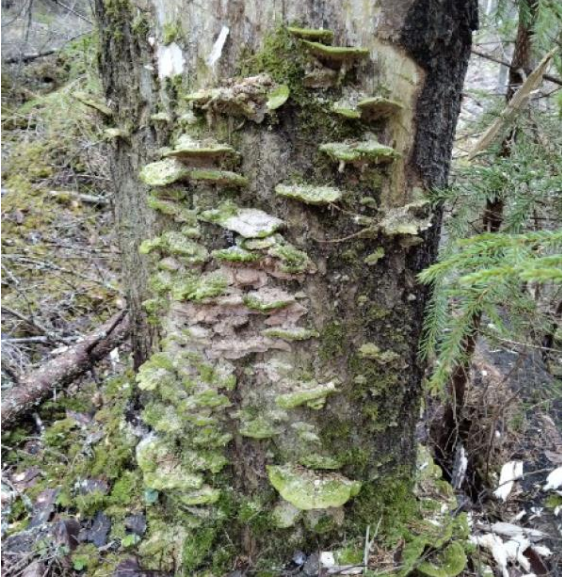
Vanha haapa Hemmunkalliolta kohti Sauviin aluetta